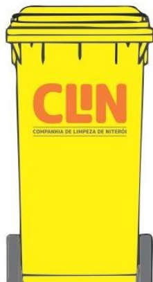
Contenedor de 120 Litros