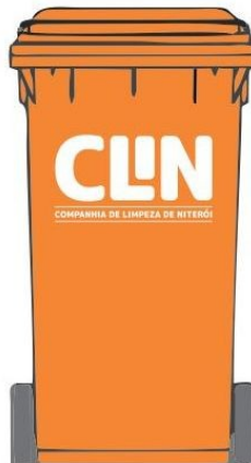
Contenedor de 240 Litros